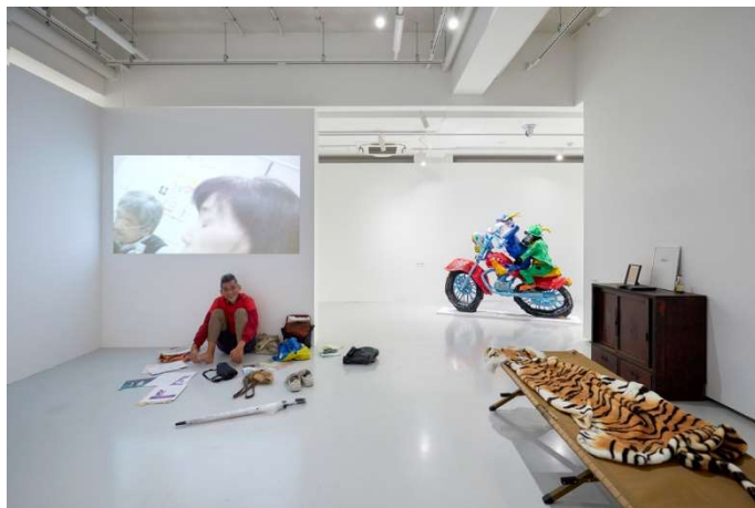
レター／アート／プロジェクト「とどく」展 会場風景

東京都渋谷公園通りギャラリーでは、3年間の「レター／アート／プロジェクト『とどく』」の集大成となる展覧会「とどく」が、いよいよ明日10月8日(土)より開幕いたします。