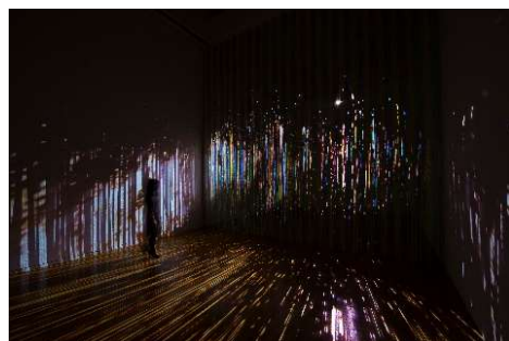
図版③ 志村信裕《Dress》2012/2015年

1984年、広島県生まれ。現在、東京都を拠点に活動。2003年、キヤノン写真新世紀で優秀賞を受賞し、写真家としてのキャリアをスタートさせる。2013年より自然光を使った写真館「天然スタジオ」を立ち上げ、一般家庭の記念撮影をライフワークとしている。写真家としての活動のほかに、自らと実直に向き合うように綴られた日記やエッセイを多数発表している。