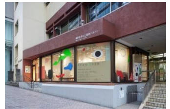
東京都渋谷公園通りギャラリー外観