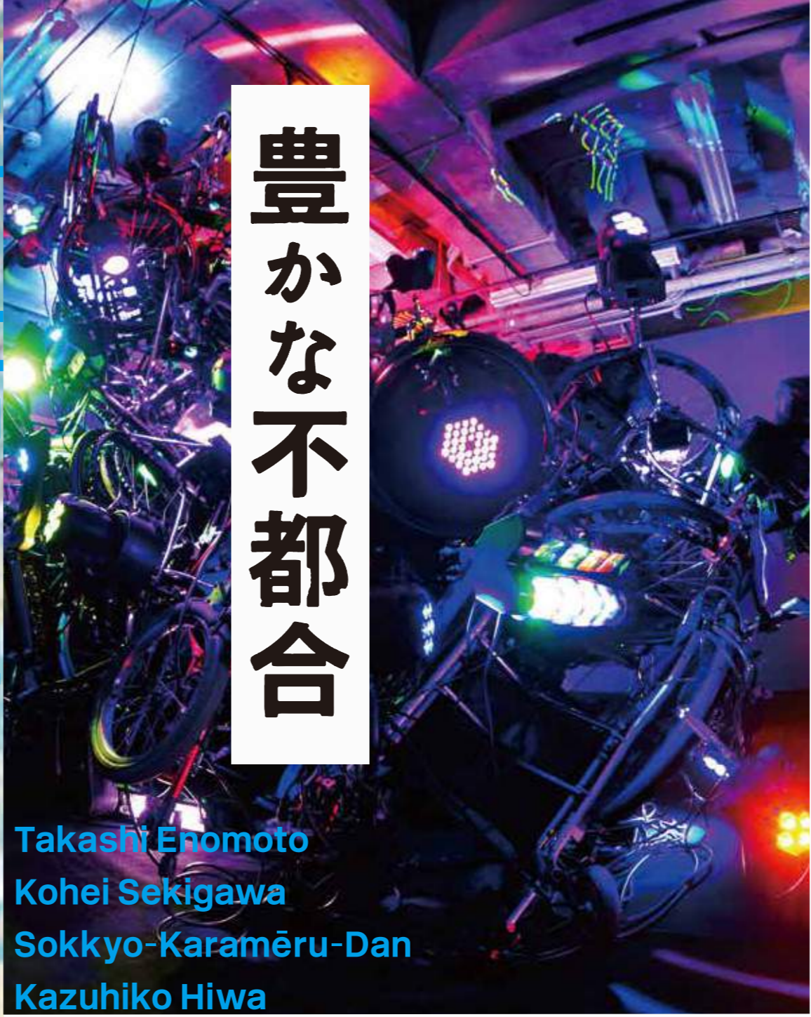
関川航平 (以外の見る) | 2017年 | パフォーマンス | 写真提供 BankART1929 Kohei Sekigawa Perspectives of Definition | 2017 | Performance | Courtesy of BankART1929